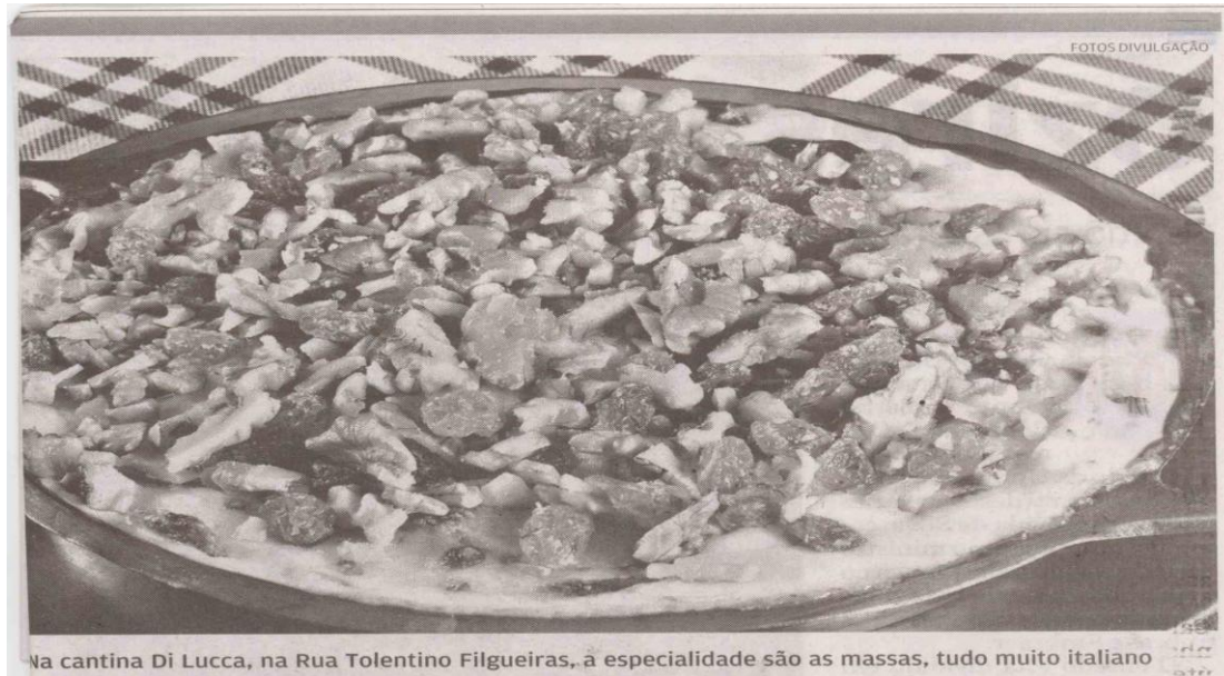
Na cantina Di Lucca, na Rua Tolentino Filgueiras, a especialidade são as massas, tudo muito italiano