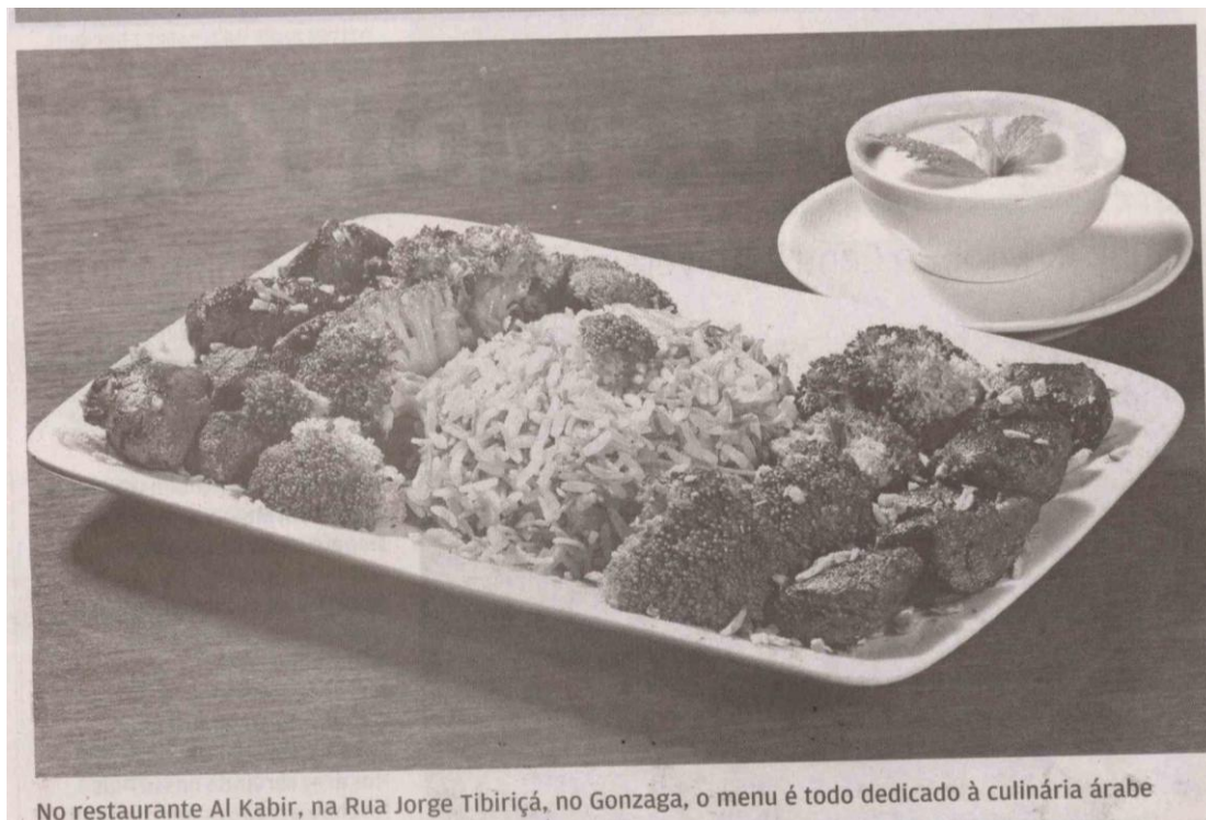
No restaurante Al Kabir, na Rua Jorge Tibiriçá, no Gonzaga, o menu é todo dedicado à culinária árabe