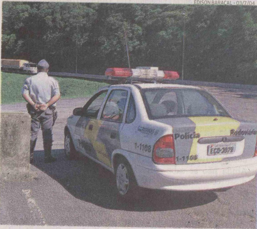
A Polícia Rodoviária pretende convocar agentes que estão de folga

val de 2010 foram registrados 153 acidentes, com três vítimas fatais. Segundo o tenente Yuki, muitos acidentes são provocados pelo uso do acostamento e ultrapassagem irregular, "o que acaba resultando em atropelamentos e colisões frontais".